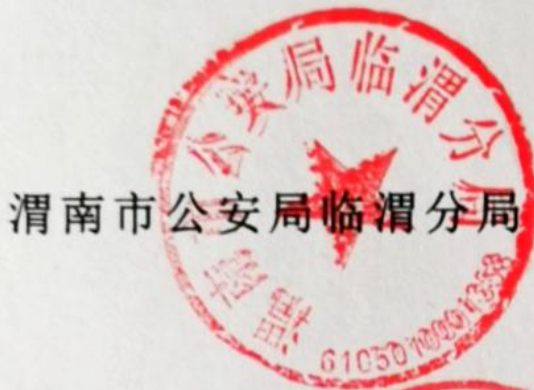
渭南市公安局临渭分局