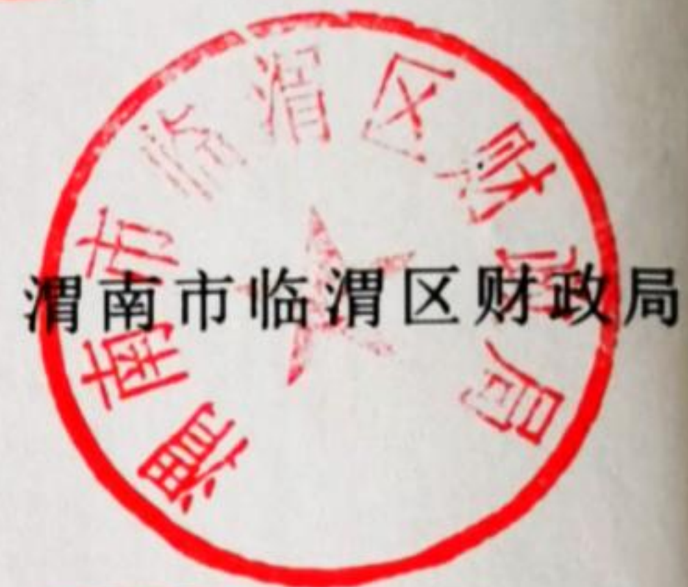
渭南市临渭区财政局