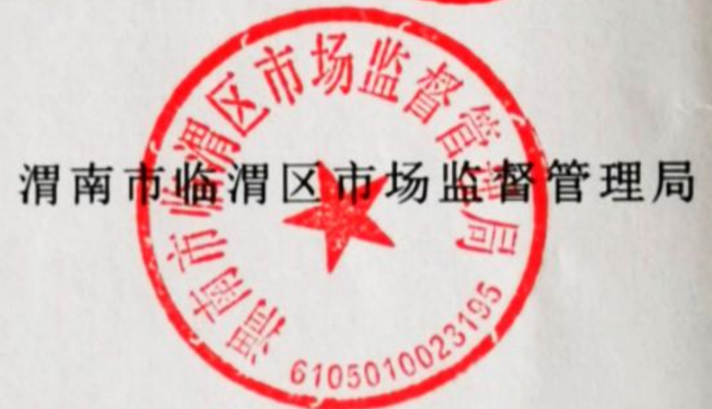
渭南市临渭区市场监督管理局