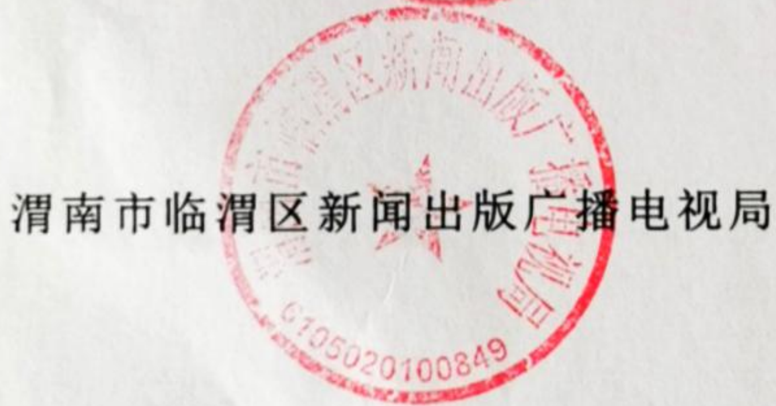
渭南市临渭区新闻出版广播电视局