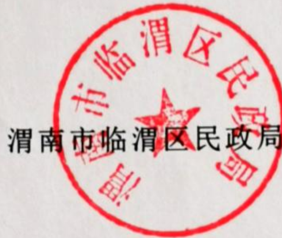
渭南市临渭区民政局