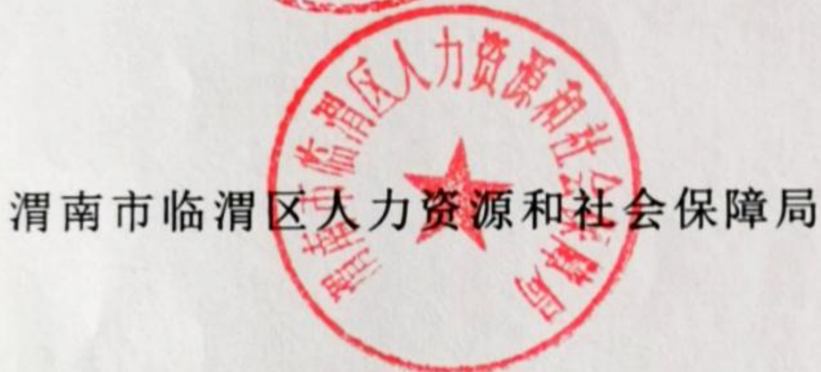
渭南市临渭区人力资源和社会保障局