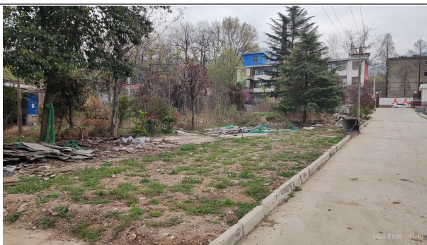
项目地东侧（临街商铺后面为空地）