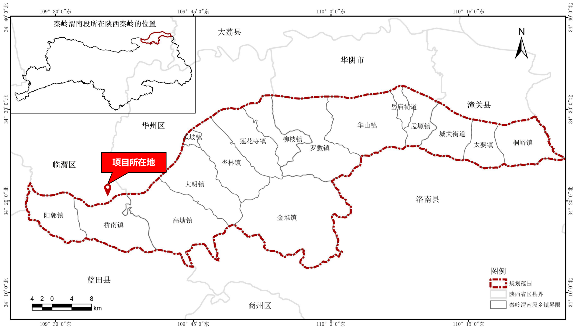
附图5 秦岭保护规划图分析