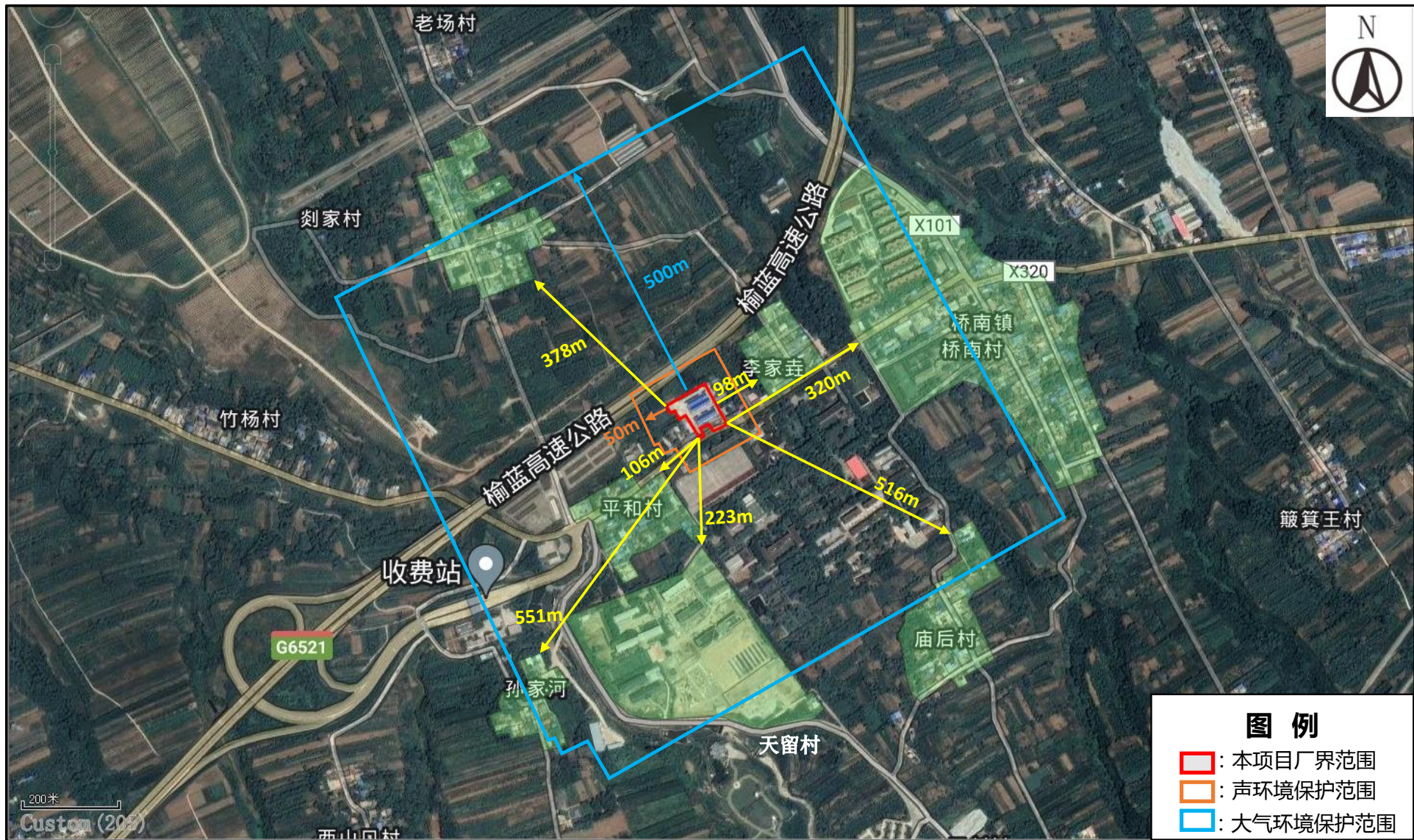
附图4 敏感目标分布图