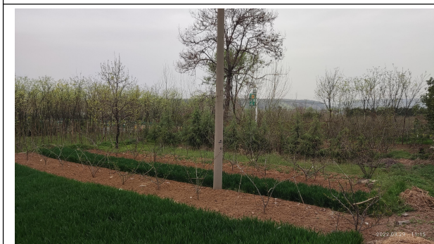
项目地南侧（田地、树地）