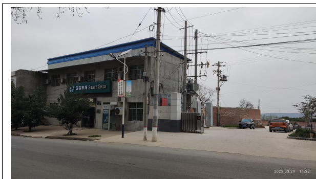
项目地西侧（国家电网等临街商铺）