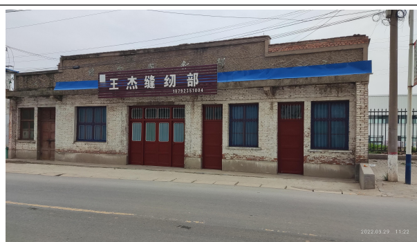
项目地北侧（临街商铺）