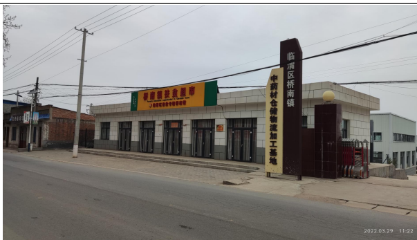
本项目产品推介厅和办公区