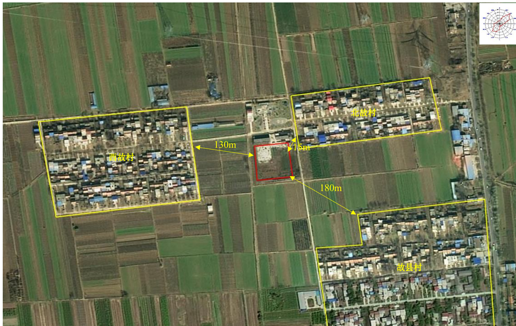
附图 2 项目周边主要环境保护目标分布图