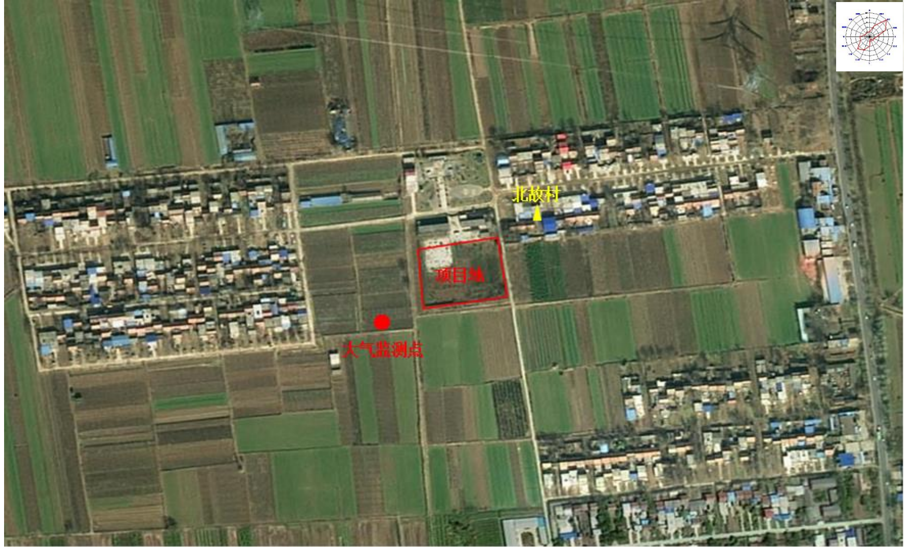
附图 4 项目现状监测布点图